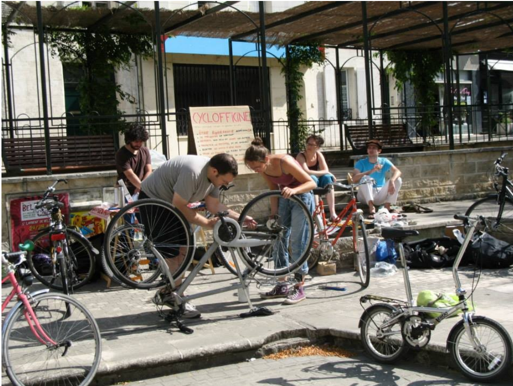
atelier mobile place du Palet, septembre 2013

Nous nous déplaçons dans différents quartiers afin de permettre à différentes populations de réparer leur vélo. Nous emmenons des outils et un stock de pièces, de la documentation et nous nous installons sur une place, dans un parc, une cour ou dans une salle. Et c'est parti !