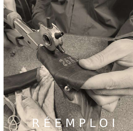
TABLEAU OUTILS CYCLOFFICINE pince à rivets, règle, dérive- chaîne, ciseaux, cutter, pince à sertir