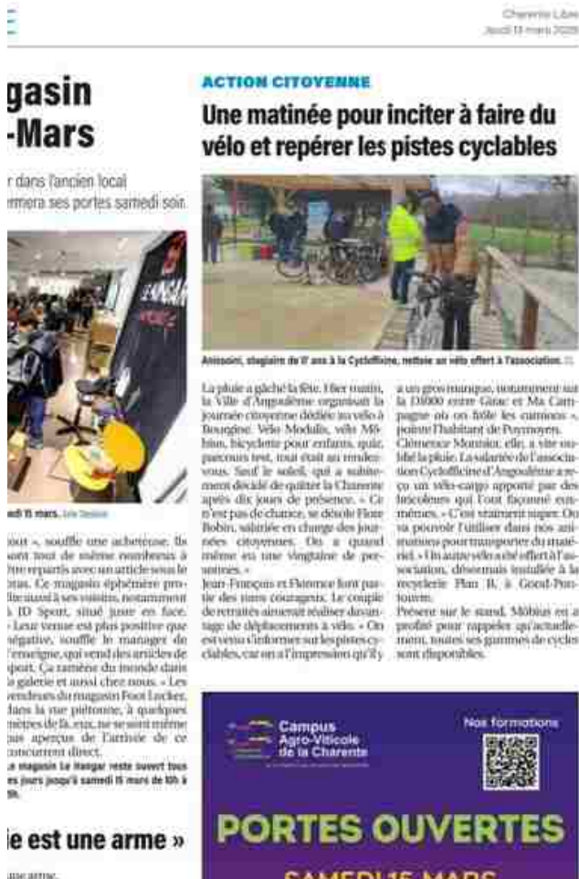
CL_13 mars 25_ Une matinée pour inciter à faire du vélo et repérer les pistes cyclables