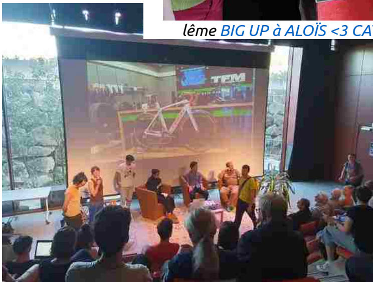
Conférence à l'Alpha "Fabriquer une culture vélo et bien d'autres choses" 10 avril 2025

Podcasts réalisés par Radio ZaïZaï à retrouver en ligne :