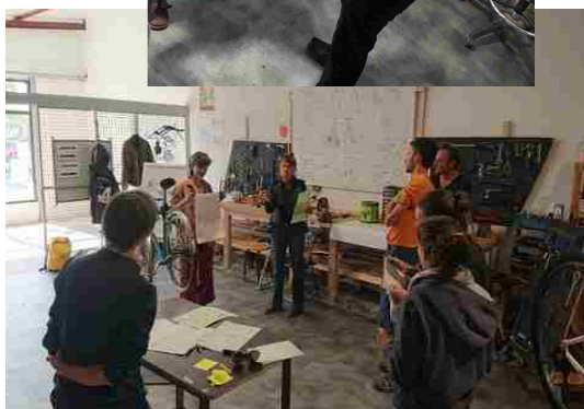
formation bénévoles : atelier participatif de réparation de vélos (oct)