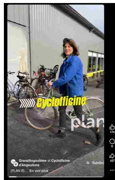
vidéo présentation réalisée par le service comm' du GrandAngoulême à l'ouverture du planB