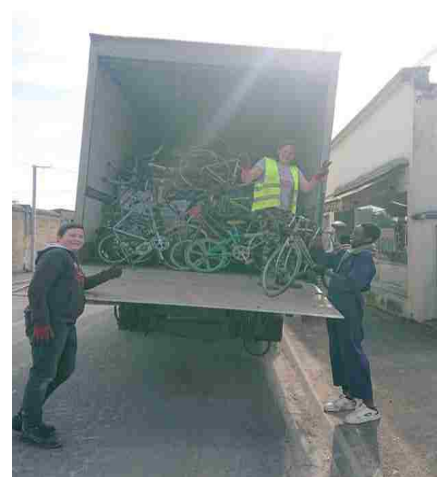
Stagiaires du FCIL lors d'un enlèvement écologique

En 2025 nous maintenons le rendez-vous habituel le mardi après-midi, ainsi plus de 45 ateliers démontage et remontage ont eu lieu.