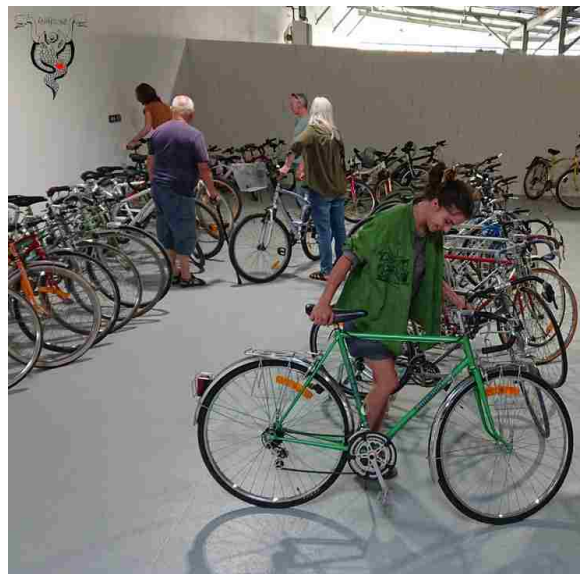
Vente de vélos planB - été 2025