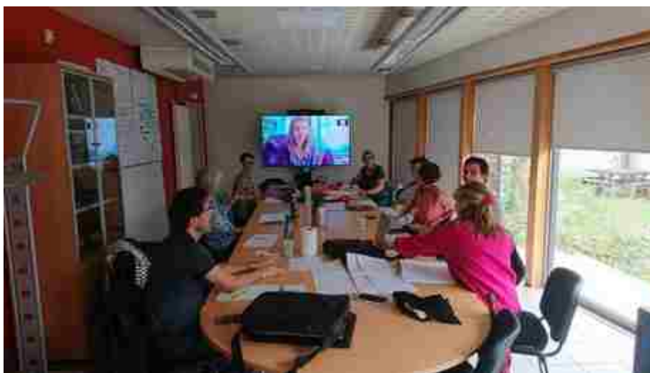
Réunion du collectif Déclics&Déchets

Fin 2025 nous répondons collectivement à l'appel à projet régionale, et souhaitant par ce soutien financier accompagner une commune vers une réduction des déchets auprès de tous ces parties prenantes (établissement scolaires, entreprises, habitations, collectivités, etc.). L'union de nos différentes spécialisations nous paraît être un réel atout pour un accompagnement sur-mesure.