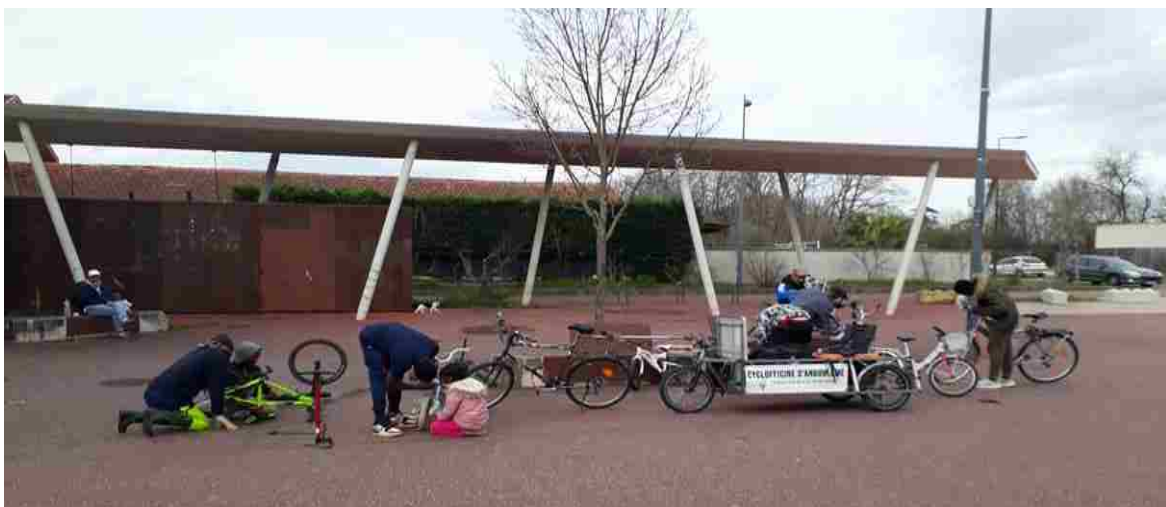
atelier mobile à Basseau

Aux Champs de Manœuvre à Soyaux , nous y avons animé 2 actions 1,2,3 vélos. Ces actions a eu beaucoup de succès et nous incitent à venir plus régulièrement dans ce quartier. En annexe un compte-rendu des actions ci-dessus est disponible.