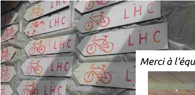
Merci à l'équipe exceptionnelle de la Cyclofficine d'Angou-