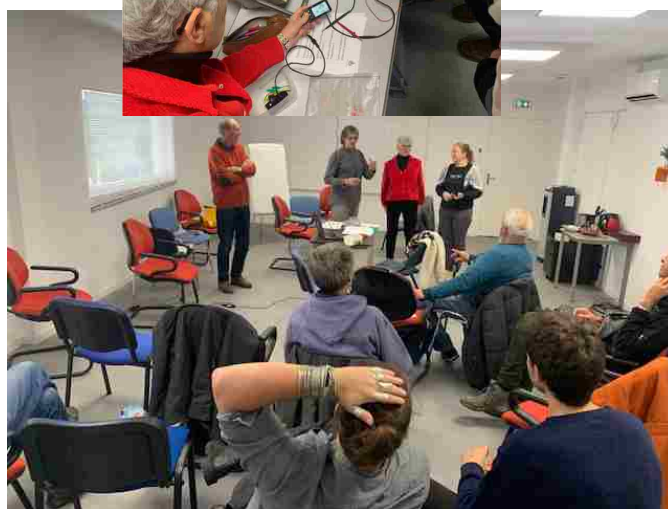
formation bénévoles : comprendre et réparer un VAE (nov)