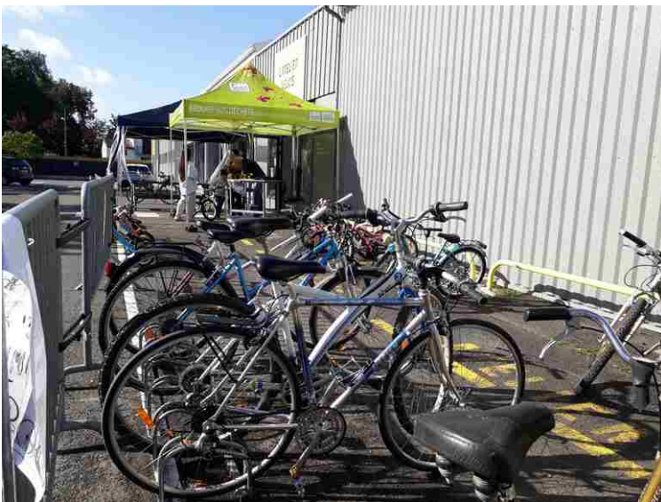
Vente de vélos planB

Il est également toujours difficile de fixer un prix « juste » aux vélos que nous vendons car un prix bas permet au plus grand nombre d'acquiescer un vélo, mais en fait également un objet jetable, auquel on ne va pas s'attacher. Difficile par exemple de convaincre une personne de dépenser autant dans le vélo (d'occasion) que dans l'antivol (neuf) !