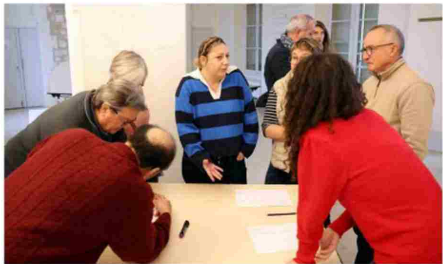
Les participants ont rassemblé leurs propositions avant que le collectif ne les transforme en plan d'actions. Renaud Joubert

Le principe : impliquer et accompagner, toute l'année 2026, un maximum de particuliers, associations, élus et entreprises autour de la prévention des déchets. Le projet est doté de 40.000€. Pourquoi Fléac ? « Ce n'est pas trop grand, il y a une grande diversité d'actions à mener et une volonté politique des élus », brosse Sabine Boutin, du service prévention des déchets de l'Agglo. Clémence Monnier, salariée de la Cyclofficine,